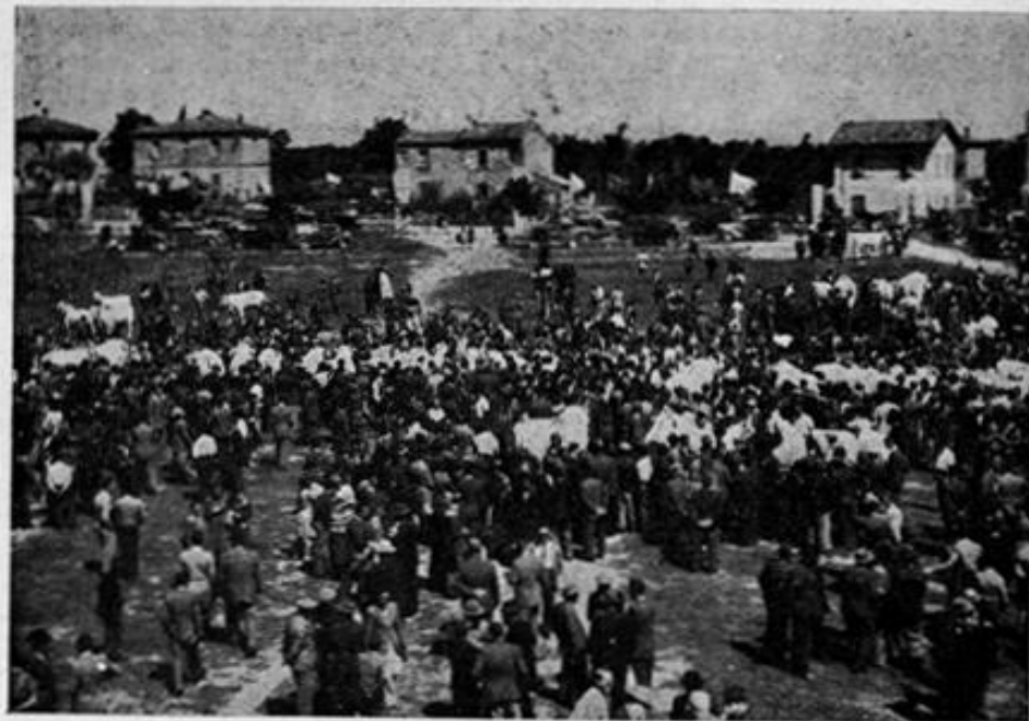
Una visione del mercato mentre gli allevatori stanno contrattando.

La media degli incrementi in peso ha superato tutti i precedenti mercati; nella 1ª Sezione, un solo soggetto era leggermente sotto la media e soltanto 14 capi su 80 non raggiungevano il 10%, in più della media.