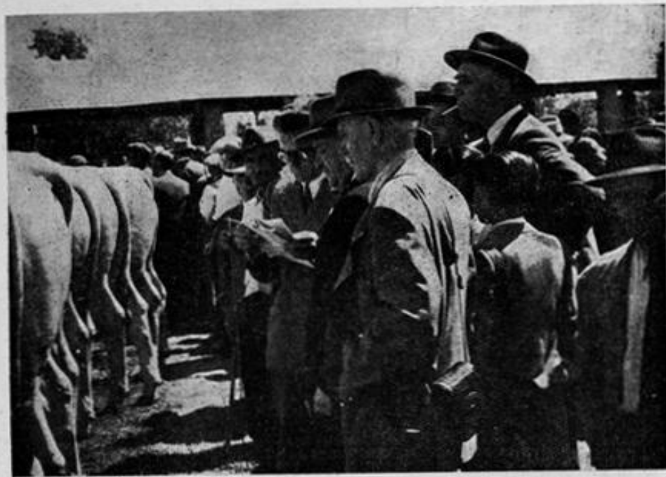
L'Alto Commissario per l'Alimentazione prof. V. Ronchi esamina i soggetti in concorso.

Eccezionale è stato il numero dei soggetti presentati (141 maschi e 41 femmine su 158 e 42 iscritti rispettivamente) essendosi superati tutti i precedenti mercati, ed eccezionale è stata anche l'affluenza di allevatori di numerose provincie centro meridionali, pubblico, tecnici ed autorità, il che sta a confermare che il Mercato di Montepulciano è una delle manifestazioni di primissimo piano nel campo zootecnico nazionale.